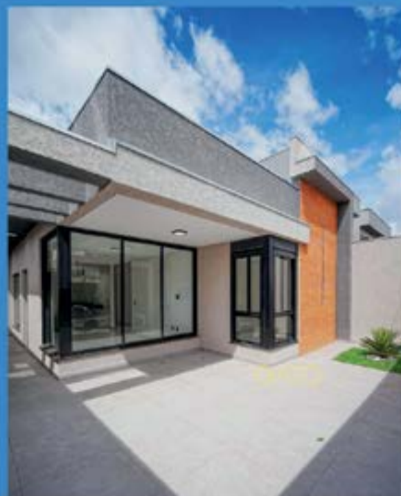
PORTAL DOS IPÊS - CAJAMAR