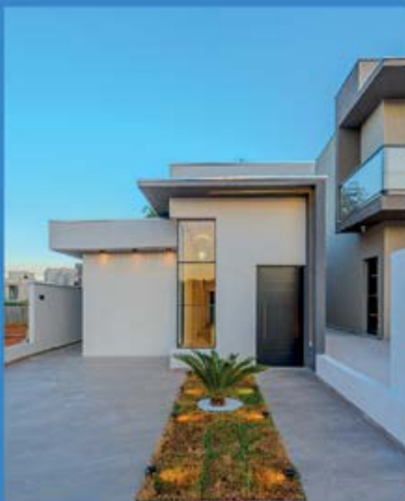
CONDOMÍNIO VILA TOSCANA