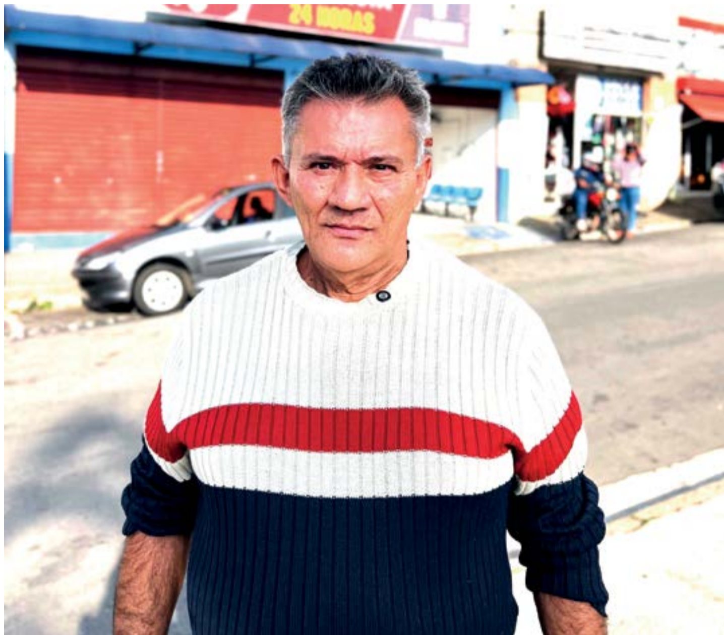
O vereador cobrou mais medicamentos na Farmácia Municipal de Cajamar e reforçou seu compromisso com a saúde da população

“Tenho recebido muitos pedidos e relatos de moradores sobre a necessidade de mais medicamentos na Farmácia Municipal, e nosso papel é justamente lutar pela população e cobrar soluções. Saúde é prioridade e não podemos aceitar que falte remédio para quem mais precisa. Seguiremos trabalhando com responsabilidade e compromisso para garantir um atendimento mais digno e humanizado para todos os cajamarenses”, afirmou o vereador.